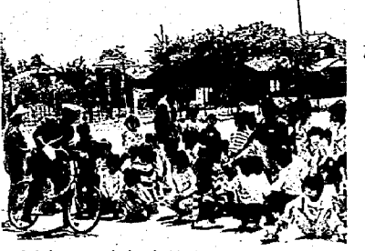
西小での自転車教室

●不正改造車を排除しよう！ 六月と七月は、不正改造車を排除する運動が実施されます。危険を及ぼす不正改造車の排除にご協力ください。