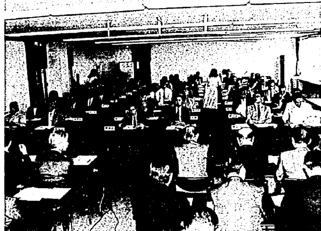
町民会館で行われた区長会議

済は、四月三十日現在で加入者数二一、〇一八人、加入率六八・七一割になりました。昨年度の見舞金給付状況は九六件で、給付金額は七一九万円でした。