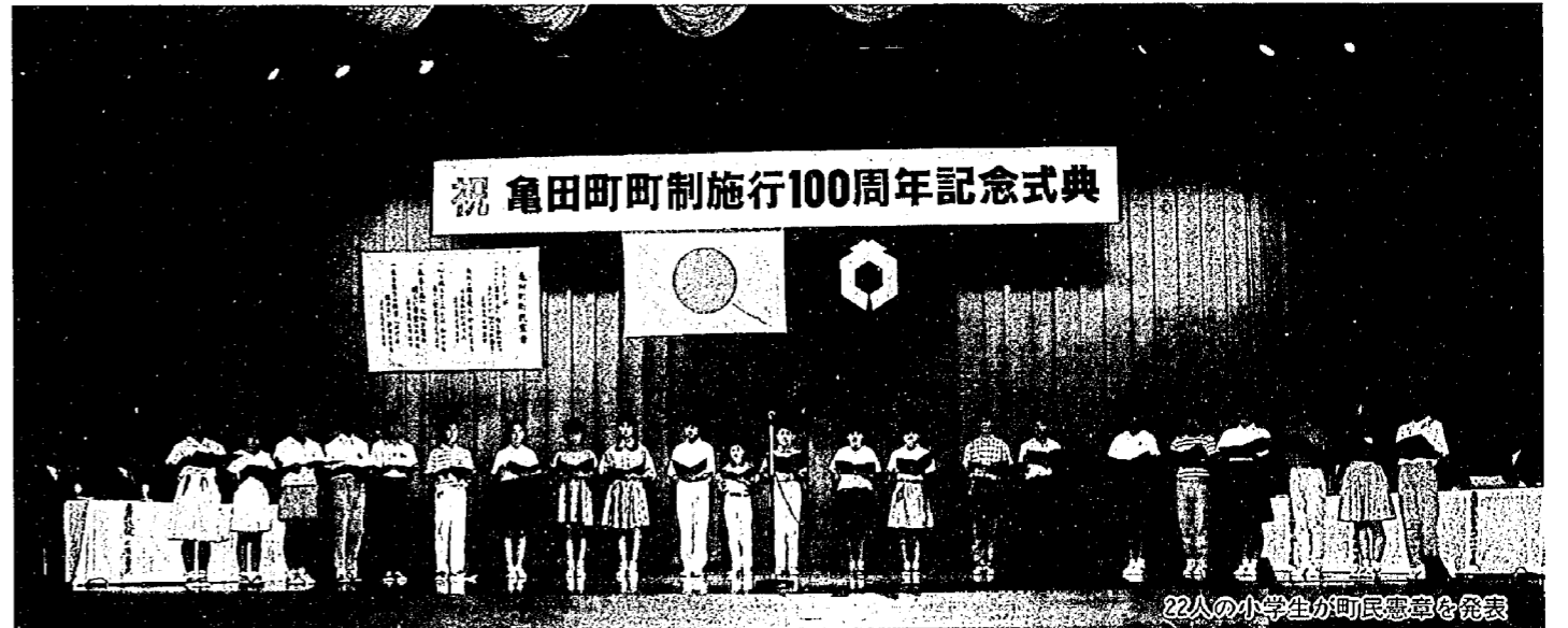
22人の小学生が町民憲章を発表