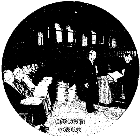
町政功労者の表彰式

亀田町の町制施行一〇〇周年を祝う「ふるさとまつり」は、八月三日の亀田甚句大民謡流しを皮切りに開催されました。 三日の民謡流し、四日の岩万燈・袋津燈籠・神楽舞いが行われた本町通りには、例年を上回る歓衆が集まり大にぎわいに。民謡流しでは飛び入り参加も多く、総勢二千近い踊りの輪になりました。