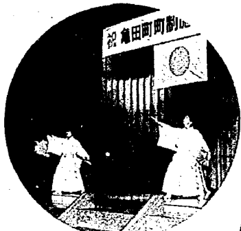
↑ レインボープラン詩吟クラブによる「祝賀の詞」