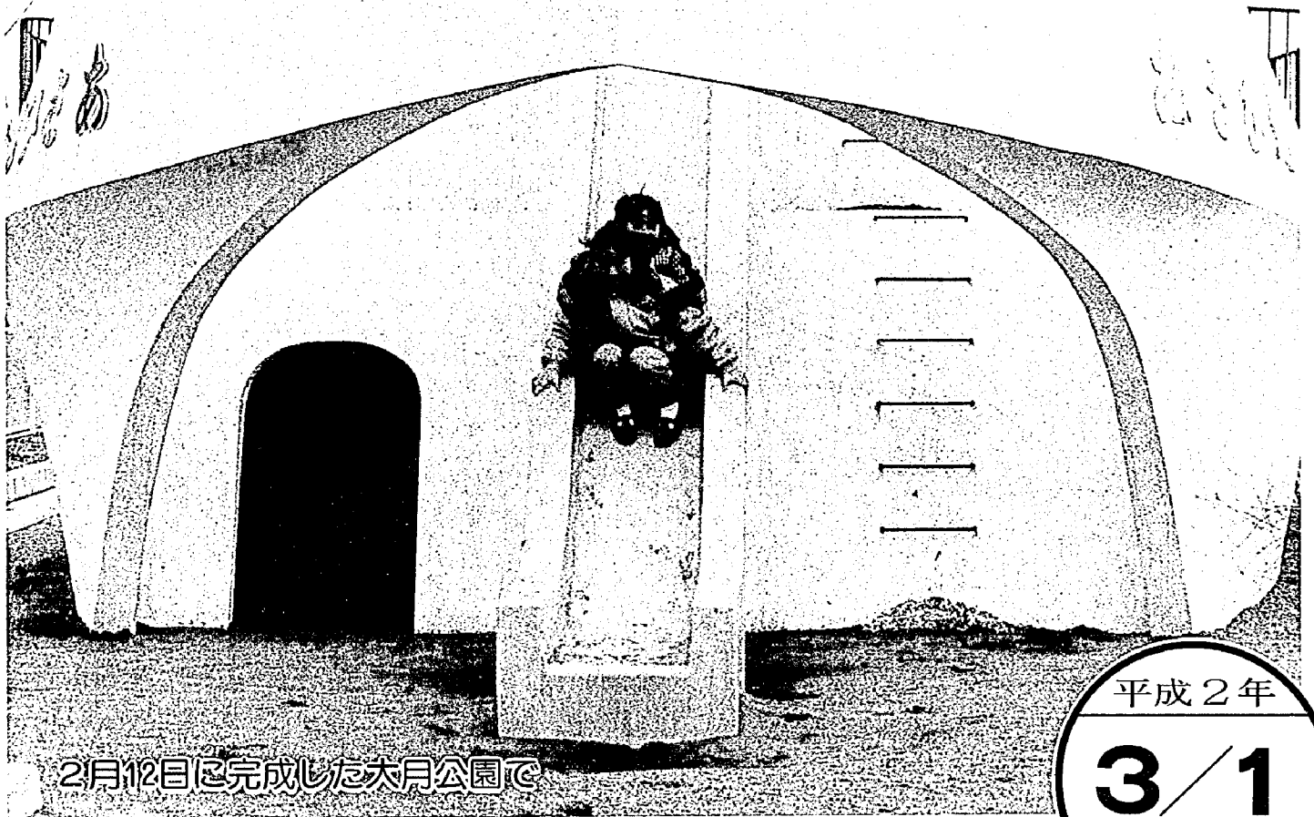
2月12日に完成した大月公園で