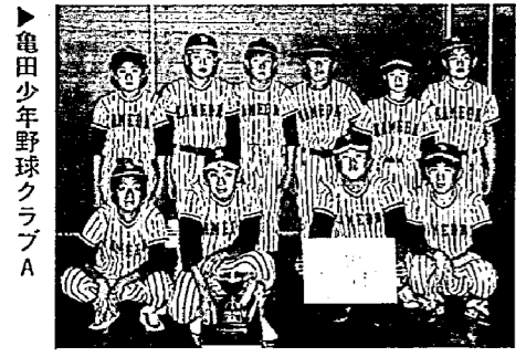
▶亀田少年野球クラブA

とき…1月4日(休) 午後1時30分 ところ…公民館 講堂 題名 ・かさじぞう(アニメ) ・アラジンと不思議なランプ(アニメ) ・さようなら、子ネコちゃん(児童劇) ※入場は無料。どうぞみなさん、お誘い合わせておいてください。