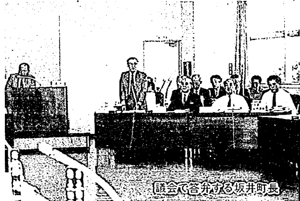
議会で答弁する坂井町長