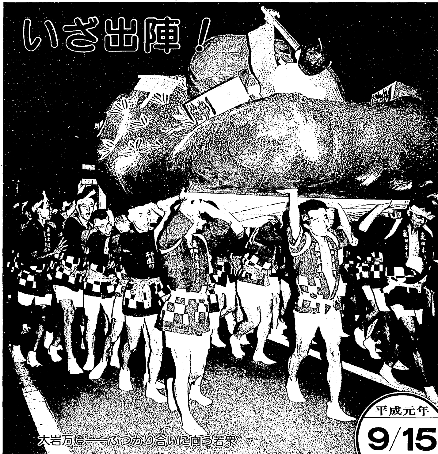
大岩万燈——ふりかひ合いを向う若衆