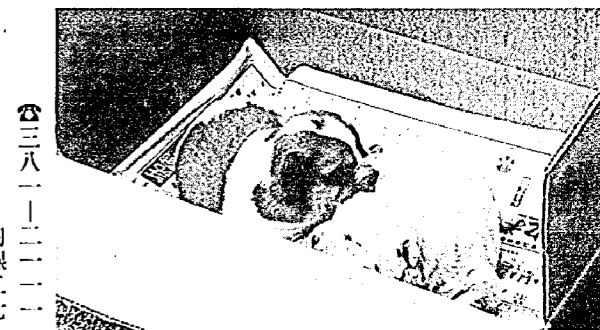
三八二二二二 内線二七

総務庁では、七月一日現在でサービス業基本調査と事業所統計調査(変動状況に関する調査)を実施します。 サービス業基本調査は、サービス業事業所の事業活動の実態を調査し、産業、従事者規模等の分布状況と活動の実態を明らかにします。また、事業所統計調査は、事業所の新設・廃業等の異動状況を調査し、事業所の変動状況を明らかにします。 6月下旬から調査員が事業所を訪問して、調査票の記入をお願いいたしますので、調査にご協力ください。