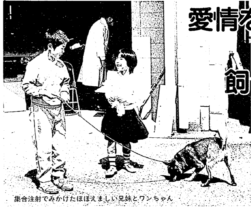
集合注射でみかけたほほえましい兄妹とワンちゃん

「ねえ、飼ってもいい？」道端に捨てられていた、生まれたばかりの子犬を抱きしめ、母親に飼うことをねだる子ども——よくある話ですが、こんな子どもたちのやさしい心、大事に育ててあげたいですね。 でも、犬を飼うには愛情と責任が必要です。あなたは愛情をもって、犬を飼っていますか？