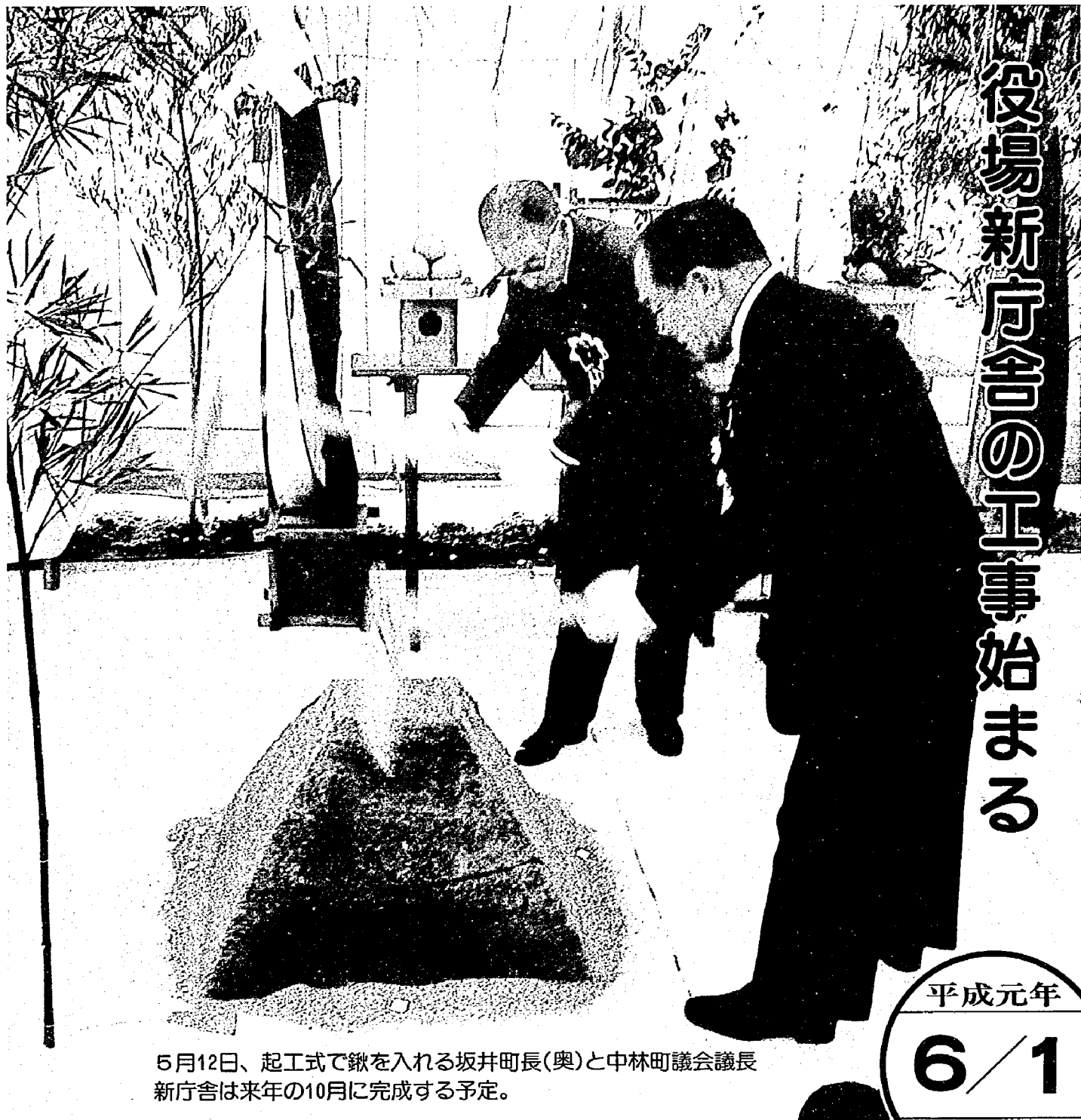
5月12日、起工式で鍬を入れる坂井町長(奥)と中林町議会議長 新庁舎は来年の10月に完成する予定。