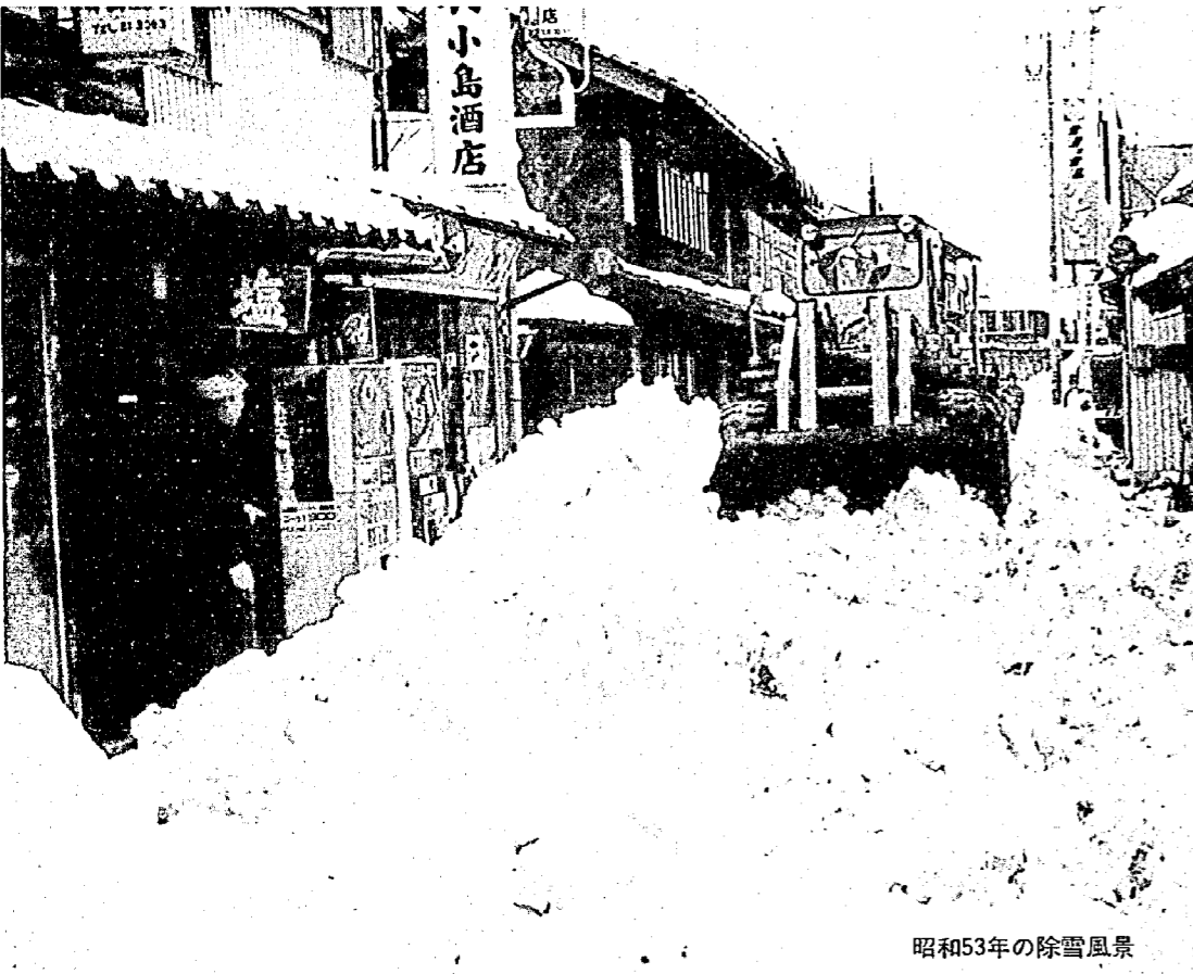
昭和53年の除雪風景

の積雪が一五センチから二〇センチくらいになると、町や協力業者を動員して、町道の除雪計画道路すべてを除雪しはじめます。 近年の豪雪では、昭和五十九年暮れから六十年にかけての冬、除雪作業は二九回にものぼりました。十二月の大雪はめずらしく、家々の屋根が雪で白く覆われた正月を迎えました。このシーズンの降雪量は五〇八九センチ、除雪にかかった費用は、町の総額で約七、〇〇〇万円でした。 除雪作業は、みなさんの「足