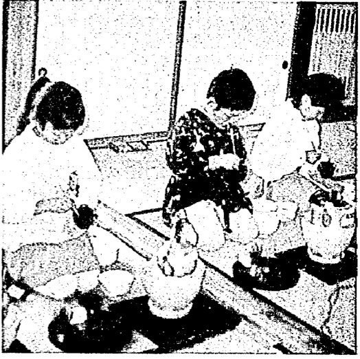
茶道にいそむ園児たち