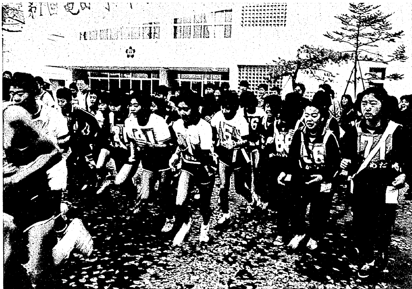
駅伝大会には44チームが参加