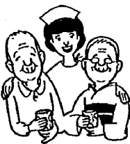
お年よりの幸せのために

十二月十一日から一月間、飲酒運転の防止、踏切事故の防止などを重点に、年末年始の交通事故防止運動が行われます。