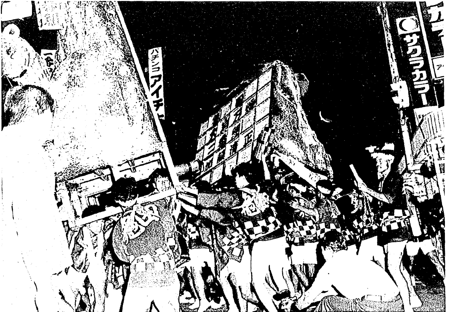
激しくぶつかり合う大岩万燈