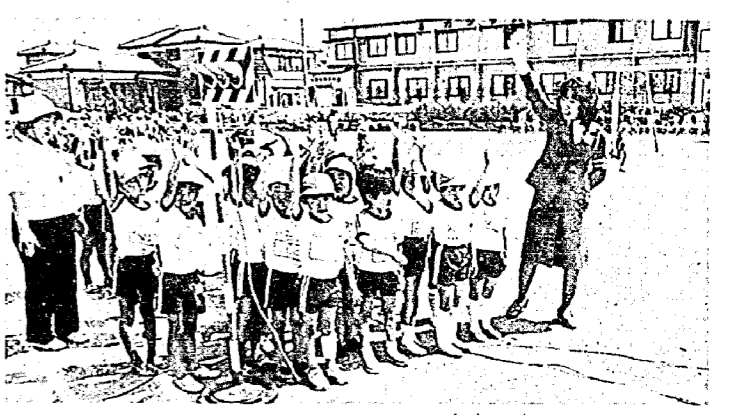
左右の安全を確かめて

九月二十一日から十日間全園いっせいに「秋の全園交通安全運動」が実施されます。この機会に、それぞれの立場から安全運動に参加しましょう。 ◎交通安全を語ろう 特に、子供の交通安全は家庭からと言われます。確かに学校や幼稚園などにおいても交通安全の指導は行われていますが、家庭生活の場は実践指導の機会がたくさんあります。 子供に交通ルールが正しく身につくか、つかないかは家庭での指導が鍵です。 ◎自転車の正しい安全な乗り方を身につけよう 子供のほとんどは、将来のドライバーです。