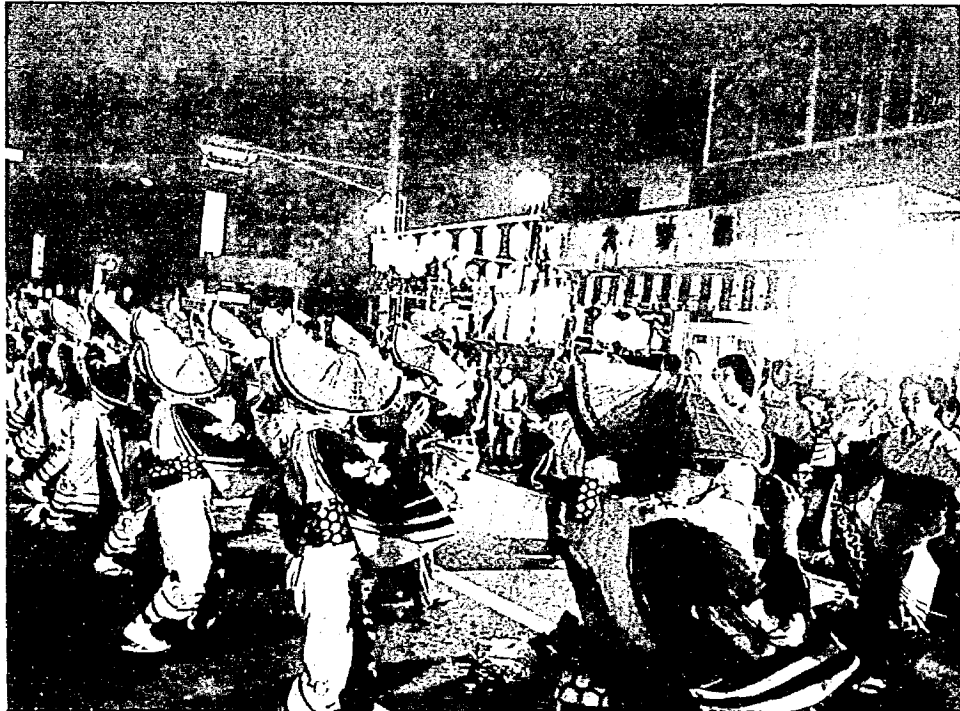
昨年の大民謡流し