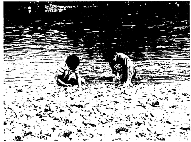
川遊びをする子供たち

は、わき見運転が常に第一位です。運転中は前方はもちろん、左右、後方に対する注意を怠ってはなりません。 ▽危険な場所があるときは、管理者に申し入れて、サクヤふたなどをしてもらいましょう。 ▽子供たちだけで水泳や水遊びに行かないように、ふだんから子供に言い聞かせましょう。 ▽出かけるときは、必ず大人が同行するようにしましょう。 ▽雨降りのあとは、川や用水が増水します。子供たちを近づけないように特に注意を。 ▽危険な水辺で遊んでいる子供を見かけたら、進んで「危ないからやめなさい」のひと声を。