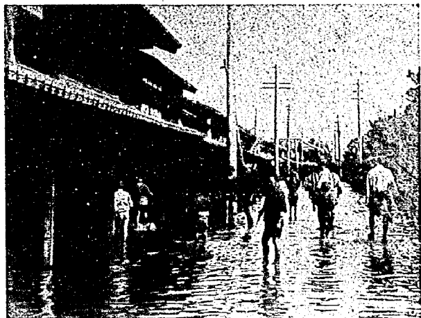
木津切れによる当町の状況

氏は高田藩の士族の家に生まれ、長じて警察に入り警部に昇進、明治二十五年一月亀田町警察署長として赴任してきた。剣道三段の達人で眼光鋭く、常に美しいおひげを生やし、謹厳な容姿を示しながらも部下に対しては極めて寛容、人々に