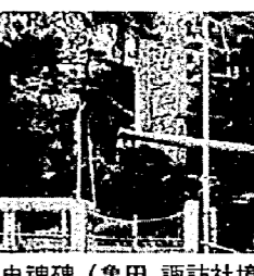
忠魂碑（亀田 諏訪社境内）

なお新潟貯蓄銀行の専務を務め金融界にも活躍された人である。 明治三十七年四月町民の要望に応え第四代町長に就任、わずか一年八か月ではあったが町民に惜しまれながらその職を去った。時に三十八年十一月である。氏の在任中