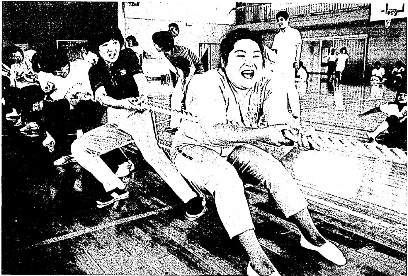
日ごろきたえたウーマンパワー