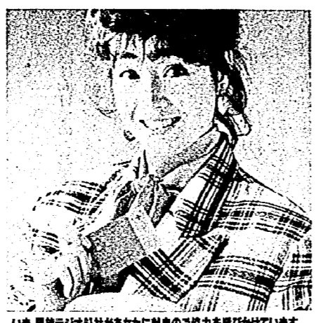
いま、異議ナシ会社があなたに献血のご協力を呼びかけています。 ●献血期間：3月7日～3月17日 ●献血時間：午前8時～午後5時 ●献血場所：各献血所

ます多量の良質な血液を必要としています。この貴重な血液は今日の科学の力をもつても、人工的に製造することができません。皆さんからの献血だけが頼りなのです。 また、献血された血液については肝機能、コレステロールの量などの検査が行われ、その結果が通知されますので、他人の生命を救うだけでなく、あなた自身の健康管理にも役立つというわけです。 献血へ、あなたのご協力をぜひ、お願いします。 はたちの献血