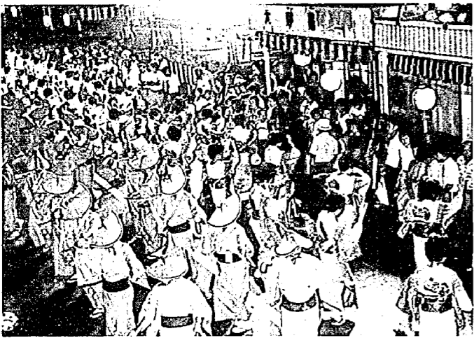
昨年の大民謡流し (本町通り)