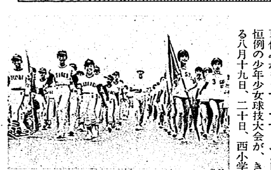
堂々と入場行進(昨年)

子どもたちが待ちのぞんでいる夏休みがもうすぐです。ことしも恒例の少年少女球技大会が、きたる八月十九日、二十日、西小学校を会場に開かれます。子どもたちは自主的に練習を行っており、事故のないよう気をつけたいものです。 とくにチーム編成には、各区の指導委員長は手をかしてやってください。 できるだけ区内の子どもでチーム編成を願います。勝敗にこだわらぬあまり地区といっしょになって区内に子どもがいるのに出れなくて困っている子どももいるようです。 ○申し込み：八月二日までに公民館 教育委員会へ ○種目：男子、野球 女子、ドッジボール ○組合せ：八月三日(金)午前七時から公民館で行います。