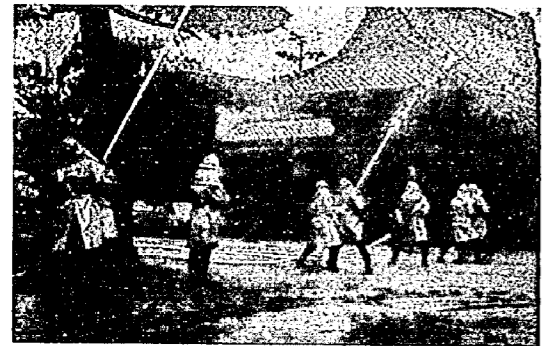
消防出ぞめ式(諏訪神社境内)

四月一日から七日まで、県下一斉に「春の火災予防運動」が行われます。春は、とくに空気が乾燥して火災が発生しやすく、また、強い風が吹くことが多く大火になりやすい状態が続きます。火の元には十分気を付けましょう。