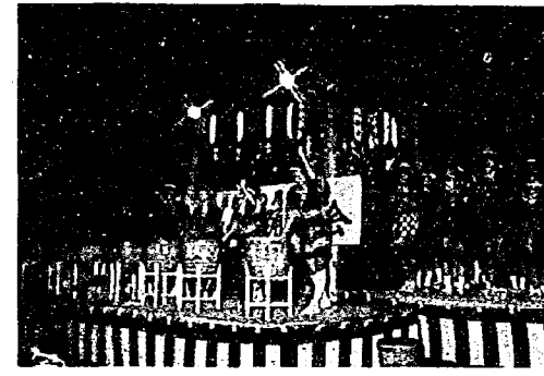
地方連のたるばやし

七月二十三日、東小グラウンドで盆踊り大会が開かれました。これは東小PTA学年行事の一つとして行われたものです。参加者は全員六年生で地方連がなんと一七人。踊りは約二時間繰りひろげられ、檜、笛、唄、踊の競演はまさに壮観そのものです。お父さん、お母さんも同伴でおおい観覧し、踊りにも参加しました。 この行事は、小学校生活の楽しい思い出としていつまでも心に残るでしょう。