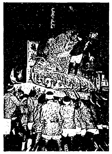
激しくぶつかりあう大岩万燈

寛文四年、伊勢の海原の石、二見が浦に連れた岩座を亀田諏訪社に奉供以來、三百十九年の歳月をかぞえています。 亀田村の開墾の歴史とともに、年一回盛大を極めた夏まつりの大岩万燈は、庶民の哀愁を秘めながら、独自の構造へと変遷して現在に至っています。 今夏は復活九年目を迎える大岩万燈のテーマは「大江山の鬼退治」で、その他に中岩万燈二台、岩御神興三台、御幣太鼓、御先太鼓の