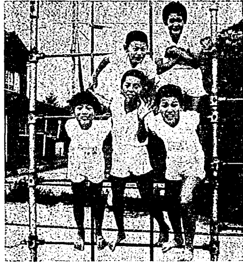
この子らを、のびのびと……