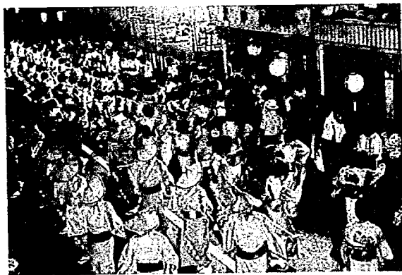
昨年の町内流し(本町通り)