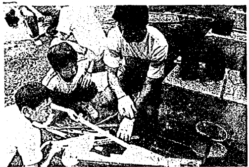
悪戦苦闘の野外炊はん

さる五月十三日にオープンした亀田町山の家も町民の皆さんから順調に利用されています。 各区の補導会や個人的な家族の利用などで日曜日ほとんど満杯のありさまで、中には公民館の少年教室のように宿泊研修もしております。これから夏休みに入ると宿泊も多くあることと見られます。 町では宿泊に備えて野外炊事場やガス釜などを設置しておりますので大いに利用して欲しいものです。 それにしても気になることは地元の人たちに迷惑をかけるまいかということ。最近こんな苦情を耳に