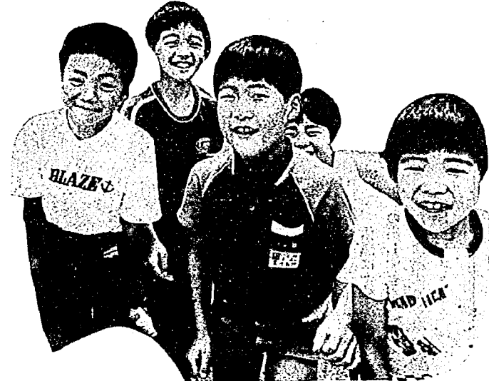
この笑顔をいつまでも……

夏期には青少年の非行が多くなります。夏休みに入ると気のゆるみから、とかく生活に乱れが見られるようになります。七月は青少年を非行から守る全国強調月間です。夏休み前の予防的措置として関係機関や地域で非行防止の活動が展開されます。