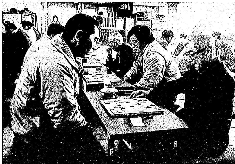
どうせめようかな(将棋)