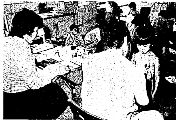
就学児健康診断(西小)