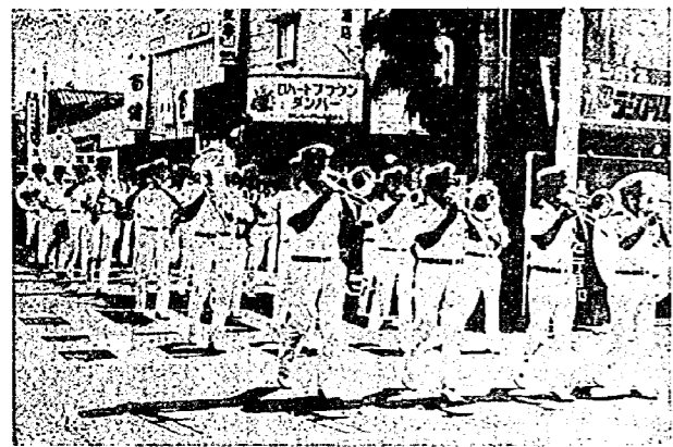
交通安全10周年記念大会(昨年)