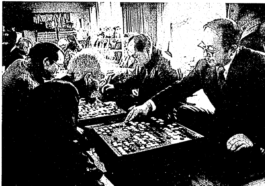
日ごろの実力を発揮(碁)