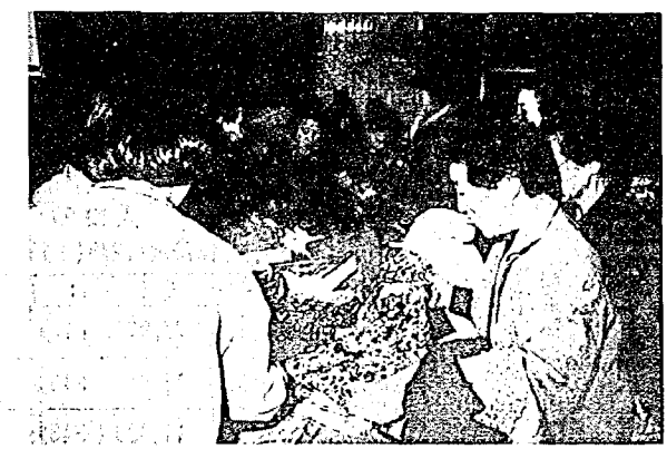
婦人会の歳末たすけあいセール（昨年）

今年も恒例の「歳末たすけあい運動」が十二月一日から三十一日まで、一カ月間にわたって行われます。 この運動は、十二月に限り行われるもので生活が困難な世帯や災害被災家庭ひとり暮らし老人あるいは社会福祉施設利用者に対し、みんなそろって明るいお正月をむかえられるよう、物心両面の援助をしようといふものです。 「お手伝いをして、もらったお小遣いをためました」 気の毒なお友達にあげてください。とあきかんを利用した貯金箱いっぱいのお金を持参する小学生や、「毎日財布に残った一円玉が一年間にこれだけ」と、五千円余を送ってきた主婦など、昨年は全国で、六十九億六、一五五万円のお金が寄せられました。 町では、区長さんを通して歳末たすけあいをお願いしています。今年もぜひ、あなたの善意の灯を思われたい人のために、十月に行いました赤い羽根共同募金は、みなさんのご協力により無事終了ことができました。集計の結果は、歳末たすけあいと合わせてご報告いたします。 大変ありがとうございました。 ◎とき：十二月四日（土） 午前十時から ◎ところ：町民会館