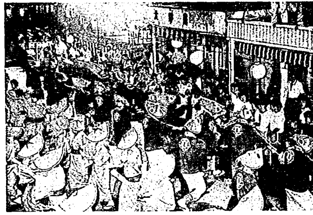
亀田甚句町内流し