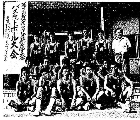
第13回新潟県中学校選抜総合体育大会