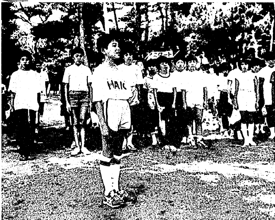
声高らかに誓いのことはを!