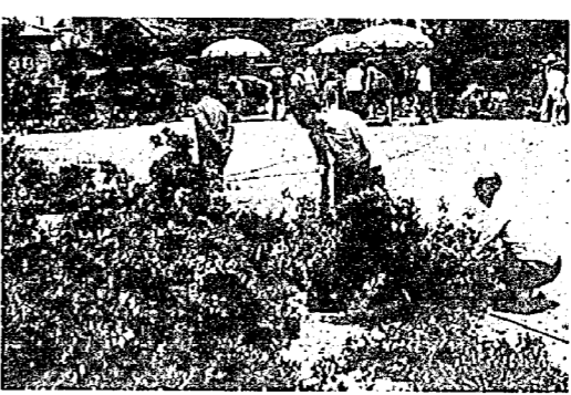
即売会(亀田農協市場)

見ごとな出来栄に会場からため息が「町内のあちこちでさつき展示会、即売会が行われました。会場では、会員のみならず丹精こめたさつき数点が展示され白や赤、紫など色どりの花が咲き、詰めかけた愛好者でにぎわいました。なかには、さし木から三十年がかりという力作もあり、自慢の作を披露していました。