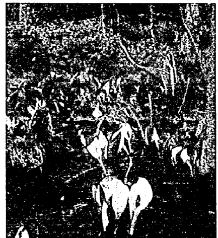
湿原に咲くミズバショウ

尾瀬の春はいつそくとびにやってきました。林の奥にはまっ白な残雪がいたるところにあり冬の名残りを思わせる。