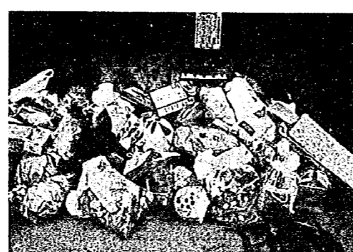
ゴミの水分はよく切って

町では、燃えるゴミの水分をよく切りましょう、燃えるゴミと燃えないゴミの分別をよくしましょう。