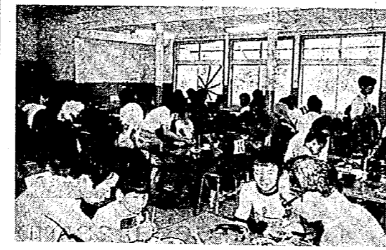
食事をする子供たち