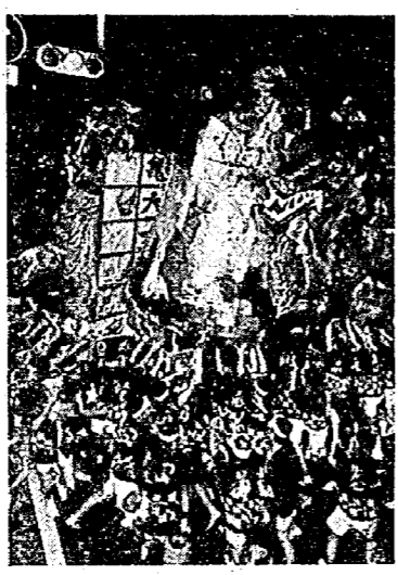
岩万燈の押し合い (昨年)

寛文四年、伊勢の海原の石、二見が浦に準えた岩座を亀田諏訪社に奉供以来、三百十七年の歳月をかぞえます。