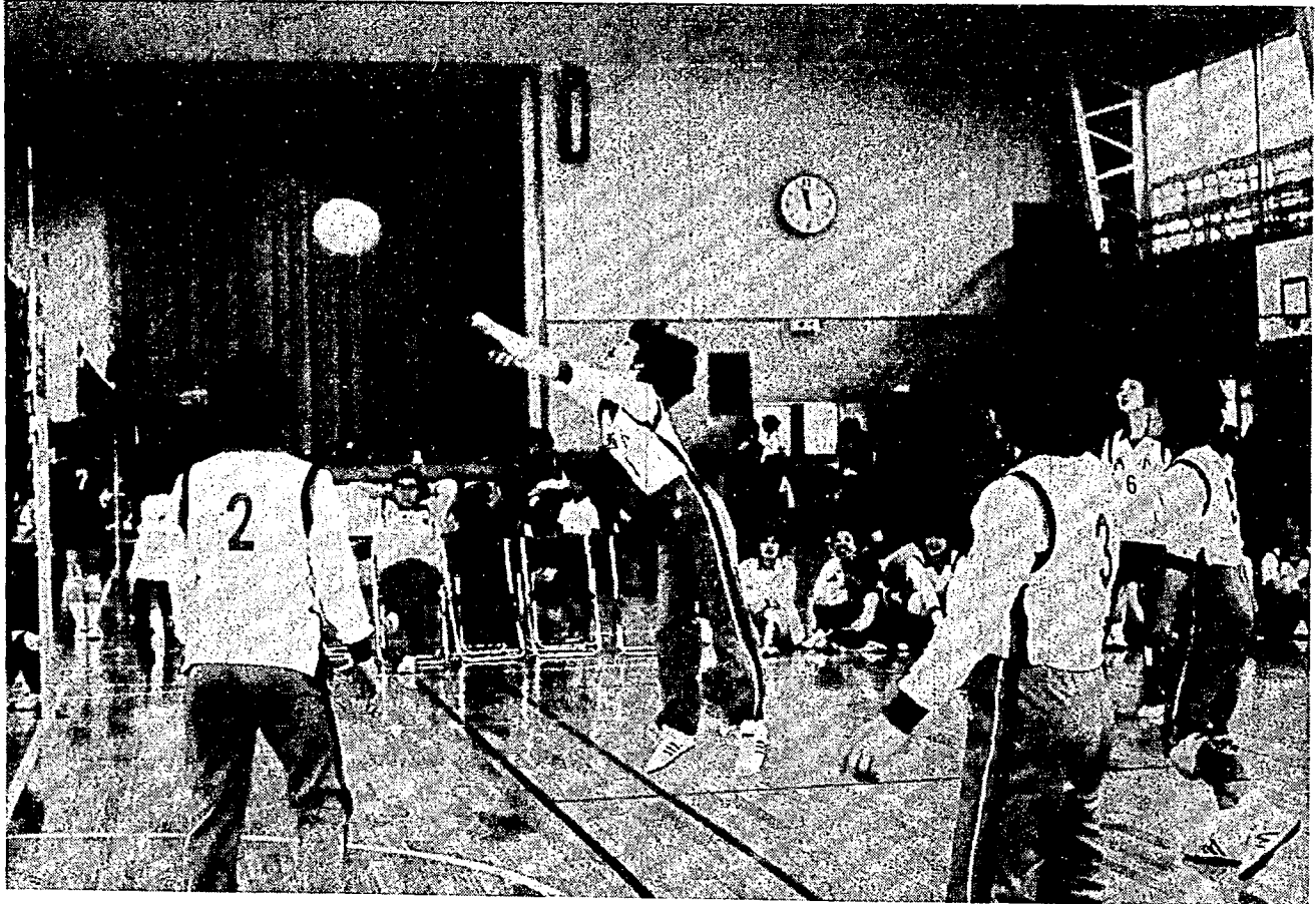
がんばる西小チーム