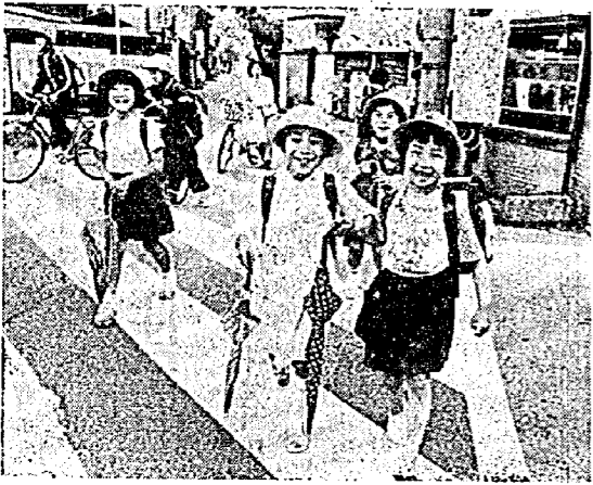
明るい笑顔で今日も通学(三ツ又交差点)

昨年一年間に県内で交通事故により死亡した人は、二百二十一人、怪我をした人は九千三百二十三人。亀田町で死亡した人は二人、