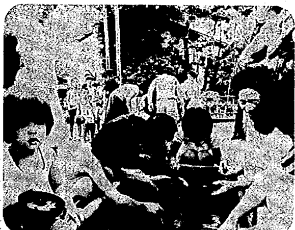
金魚を追いかけて金魚すくい大会