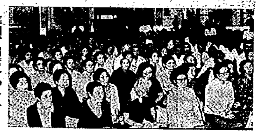
毎回、出席者の多い福寿大学

です。すから、子供は、まずお母さんを通して、さらにお父さんとお母さんのやりとりを聞きながら、言葉の使い方を身につけていきます。 一見、聞いていなきさそうに見えても、子供は、親の会話を膚で感じながら、自