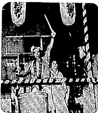
パチのさばきも鮮やかに