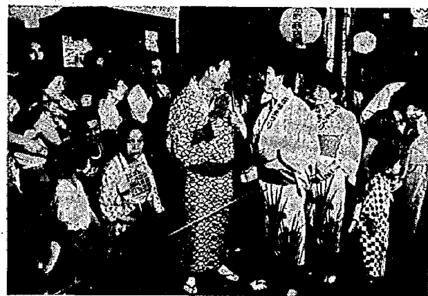
東京からの帰省客も踊りに参加