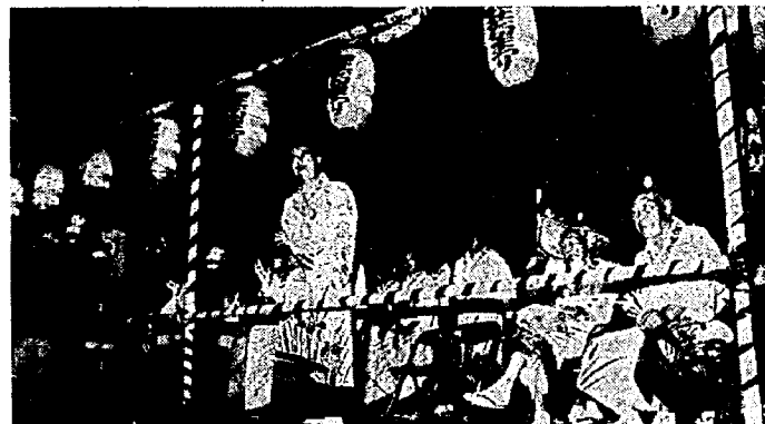
民謡流しの開始を宣言する宮腰会長