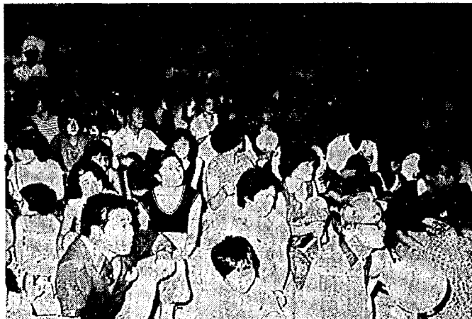
リラックスしたカラオケ大会の観客