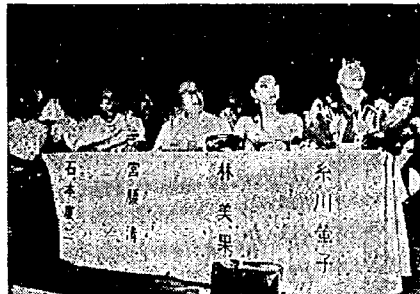
ゲストをまじえて宴卓風景