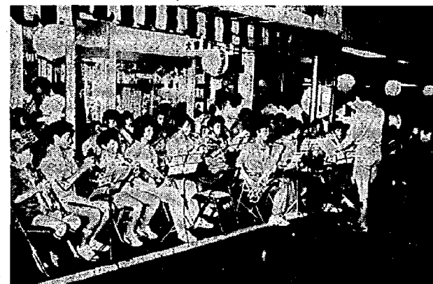
ボーイスカウトの演奏