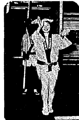
ハッピー姿で参加