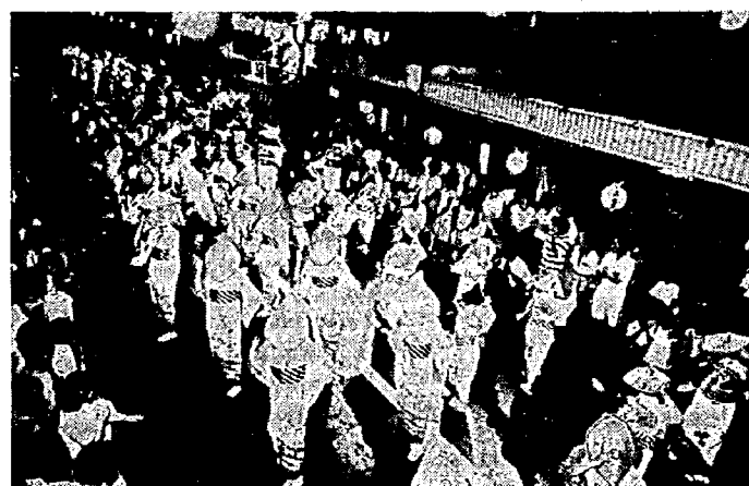
そろたそろたよ踊り子がそろた

ところが、夜に入りますと不思議なことに、午後七時から開始された鼓笛隊のパレードからは、雨はすっかりあがり、どんよりした空のもとでしたが、暑さ知らずの涼風の中で盛大に民謡流しを無事終ることができました。これこそまさに天の恵み関係者一同の祈る気持が天に通じた民謡流しでした。