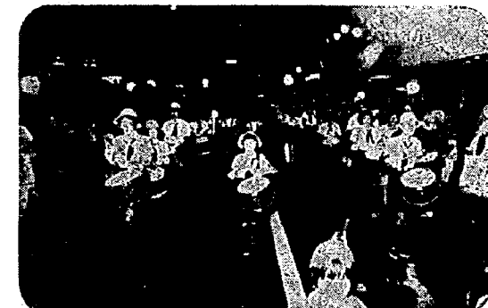
整然とすすむガールスカウト鼓笛隊

テーマは「天の岩戸」と「八岐の大蛇」で、若衆たちが力のある限り押しあい大岩万燈、木遣り音頭に太鼓と笛、拍子木に怒号で熱気が渦巻き、汗が飛び散る勇壮な夏まつりでした。