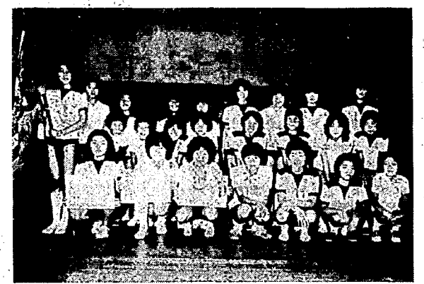
苦闘をのりこえての勝利

ール会場では耳も破れんばかりの喚声です。勝っても敗けても涙々です。さわやかな子どもたちです。 夏休み期間中練習に励んできた成果をためすのはこのときとばかり一生懸命にプレーをしておりました。 成績は次のとおり 野球の部 一位 早通チーム 二位 711区チーム 三位 56131421区チーム ドッジボールの部 一位 172729区チーム 二位 333437区チーム 三位 51区チーム 三位 81842区チーム