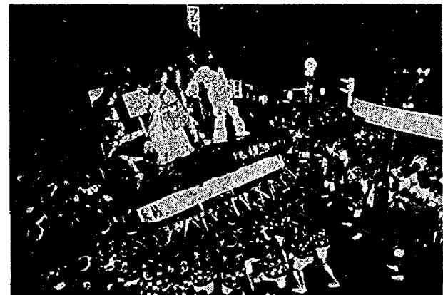
木遣り音頭によってぶつかり合う大岩万燈