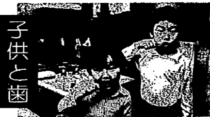
むし歯予防は、まごめがきから。

あなたの年金は、特別に過去の未納保険料が納められ、将来年金が受けられるという制度です。 もう一度、納め忘れた保険料がないか確かめてください。 詳しくは、住民課年金係におたずねください。 電話：二二一内線三三三