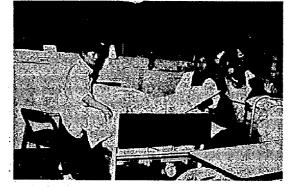
奉仕活動に精を出す学生

ささてあげた時の老人の生き生きとした顔をみると、なんとかやりくりも待っているようにも思える。皆さんのお手伝いも待っています。りんごの皮をむいて食べます。