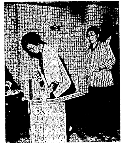
昨年の衆議院選挙（町民会館）

選挙が明るく正しく行われるためには、選挙人が国政に対する関心をますます強めることが必要です。良い政治、明るい政治はあなたの投票から始まります。 投票はだれにも支配されず、自分の判断で投票しましょう。 投票の秘密は堅く守られます。あなたに代ってよりよい政治を作りだしてくれの人に投票しましょう。 投票できる人 ▽年齢要件 昭和三十五年六月二十三日前に生まれた人、ただし以前に生まれた人、ただ