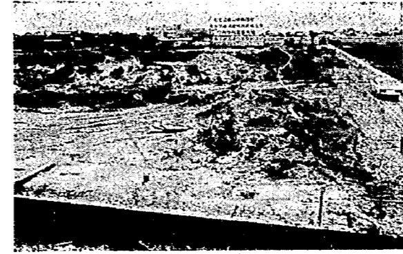
造成が進む早通団地

東小増改築工事は三月十四日現在、建築工事の進捗率八〇割で、建築工事の進捗率九八割です。残工事は玄関仕上げと後片付けを行います。母子寮新築工事は三月十四日現在、進捗率九七割で残工事は畳敷きと外回りの後片付けを行います。