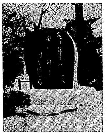
亀田諏訪神社境内に建立された句碑