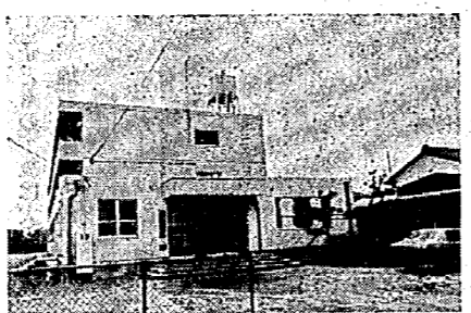
さつき荘(母子寮)完成

国民年金積立還元融資などで 昨年八月、着工した母子寮「さつき荘」の建設工事は、三月完成し、十五世帯の方が四月に入居されました。工事費は、約一億二、〇〇〇万円、国民補助金八、四三二万円、みなさんが毎月積立されている国民年金積立金の三、二六二万円などの融資をうけ完成しました。