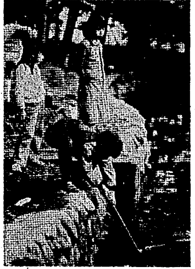
水辺での遊びは危険がいっぱい

再度、このような事故を起さないようにするため臨時議案が開かれ、対応策として危険物のごみ収集を絶対に行わないことになりました。