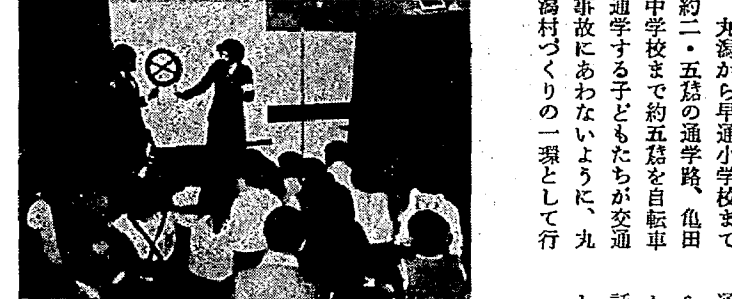
巡視員のお姉さんから交通安全の話を聞く

子どもたちを交通事故から守ろうと、丸湯部落PTAでは、新学期の四月五日に新入学児、保育園児を中心に交通安全教室を開きました。