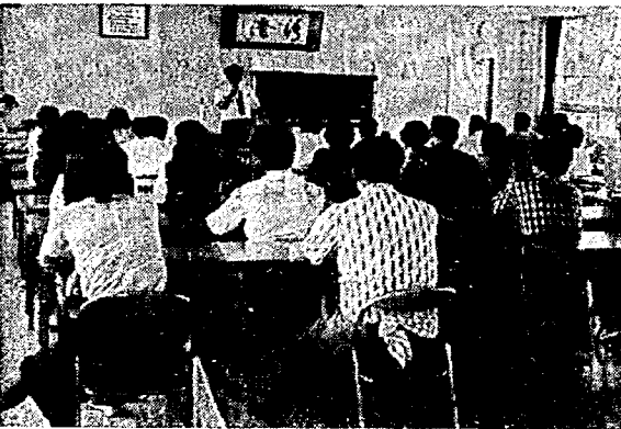
事故減少に効果のあった講習会

交通事故・詐欺・横領その他 の犯罪の被害者で、検察官の不 起訴処分(犯人 を裁判にかけない こと)に不服 の方は、検察審 査会に審査の申 立てができます 検察審査会とは 国民の代表として、 衆議院議員 の選挙権を有す 新潟市学校通一の一 新潟地方裁判所内 新潟検察審査会事務局 ☎(025)41-1311番