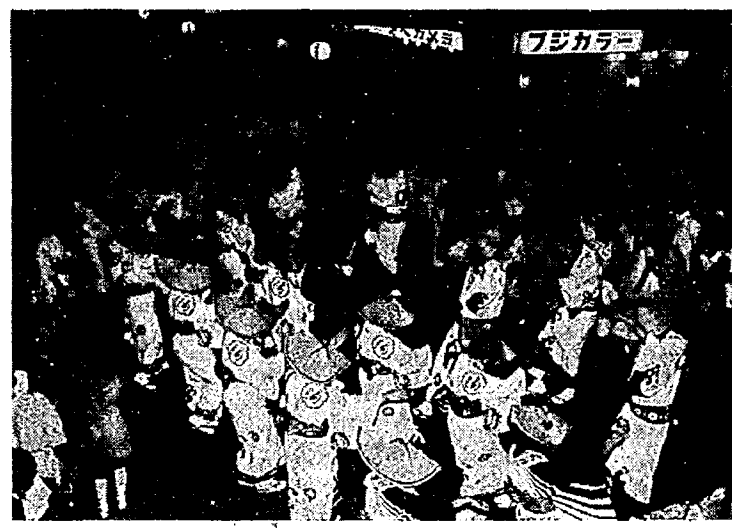
くりひろげられる町内流し (昨年)

「ふるさとを見直す運動」は、今や全国に広がり、地域にさまざまな行事が催されています。昭和四十七年八月から行われた「亀田甚句まつり」も、八年目を迎えることになり、盛大な夏まつりとして定着し、町民総参加の合言葉のもとで親しまれるようになりました。 四年前から岩万燈の復活と合わせて、八月二十五日に「町内流し」が行われていましたが、参加者の多く特に婦人から「お盆期間中に復活させ、帰省客からもふるさとの味を見直していただきたい」との要望があ