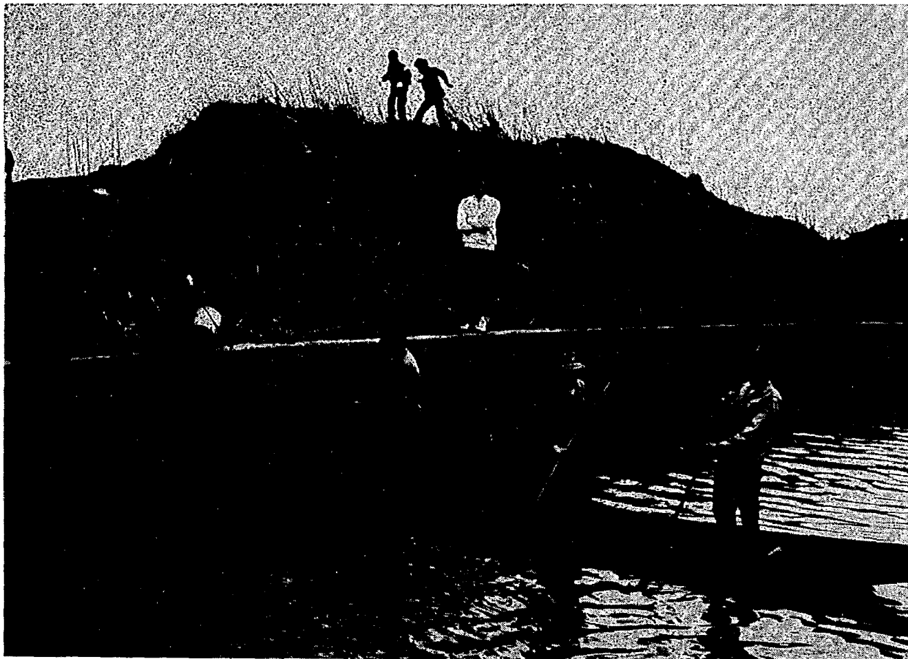
デンゴ棒とガチャ棒でふなを追う (清五郎川で)