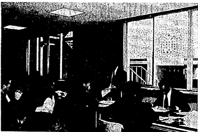
去年の所得税の確定申告

昭和五十三年分の所得税の確定申告と、納税の時期がきました。所得税の確定申告は二月十六日から三月十五日までです。 所得税の確定申告は、納税者のみなさんが、一年間の所得と税金を正しく計算して三月十五日までに納税する手続きです。 亀田町では、二月十九日から三月十三日まで、別紙日程表のとおり町民会館において、申告書の受け付けを行いますから、指定された日においでください。 ▽確定申告をしなければならぬ方 (1)五十三年の各種の所得金額の合計額から配偶者控除額を差し引いた金額が、二十万円を超える人。 (2)五十三年分については、みなし法人課税を選択している人は、たとえ税額がない場合でも申告しなければなりません。 ▽給与所得がある場合 (1)五十三年の給与の収入金額が、一千万円を超える人。