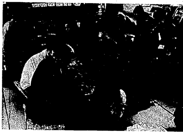
熱気に包まれた昨年の大会

恒例になりました新春町民囲碁・将棋大会も今年で五回目を迎え、年々参加者も多く愛好者が楽しみにしています。