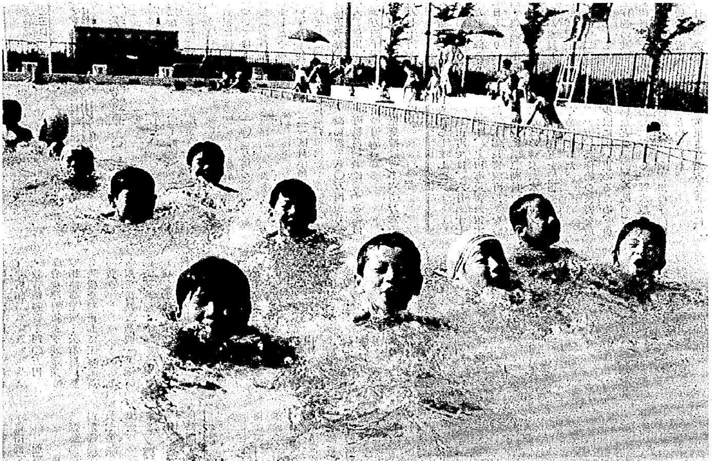
亀田焼却場附属プールで