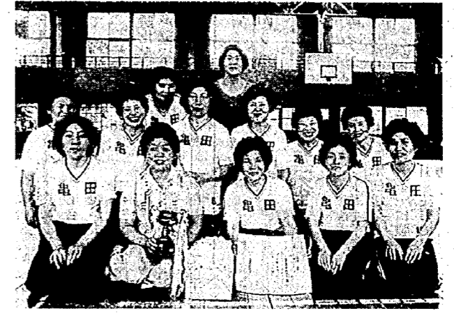
優勝カップと賞状を手に よろこびの亀中母の会チーム

さる六月二十五日、亀田中学校体育館で第十二回婦人バレーボール大会が開かれました。また七月九日には町民グラウンドでソフトボール大会が行われました。この大会は県民スポーツの日の記念行事の一環として行われたもので、この二種目を中心に行われているスポーツ大会が行われておりま