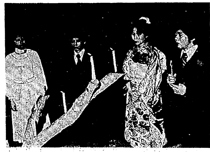
聖火の前で「はたちの誓い」 (昨年の成人式)

雪国の越路にも、よりや く春の息吹きを感じられる 頃となりました。 卒業、進学、そして就職 と祝い、励ましの季節とい えましょう。若人はそれぞ れ新しいスタートに立ちま す。