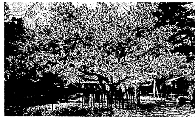
通心寺の雲井桜