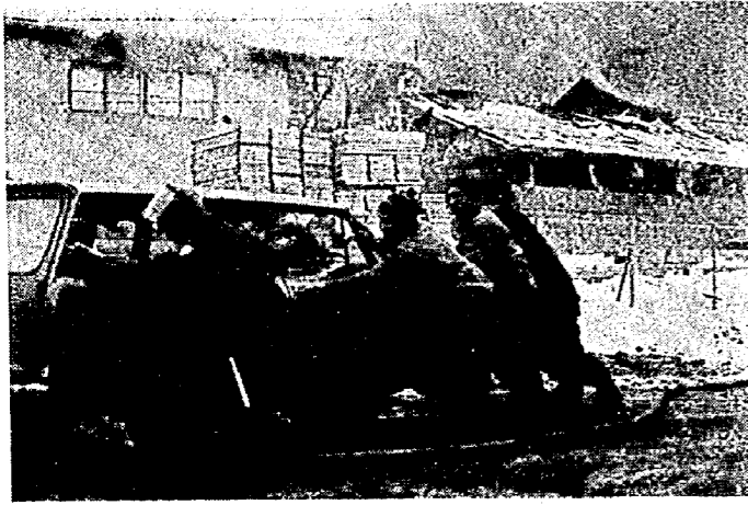
火災発生、違法駐車絶対しないで

昭和四十五年の交通事故は、前年より四六・八%増し、県下市町村の中で最高の増加率になりました。この中に三名の死亡事故も含まれています。交通事故者といわれる「子ども」と「老人」の事故は、全体的に増加の傾向にあります。運転者は子どもや老人を見たら、赤信号かと思つて、くれぐれも安全運転につとめてください。子どもさんをお持ちの家では、外出の時こそ良いチャンスです。実際の現場で、子どもたちが理解できるようなしよになって指導し、事故に合わないようにつとめてください。 △「声運動で」 交通事故の防止を子どもと老人の交通事故防止は、まず家庭の主婦の一声が一番大切です。登校出勤、外出の際はぜひお母さんが注意のことばを掛けてください。 交通事故防止、今日一日の安全は、お母さん、あなたの「声運動」から始まります。