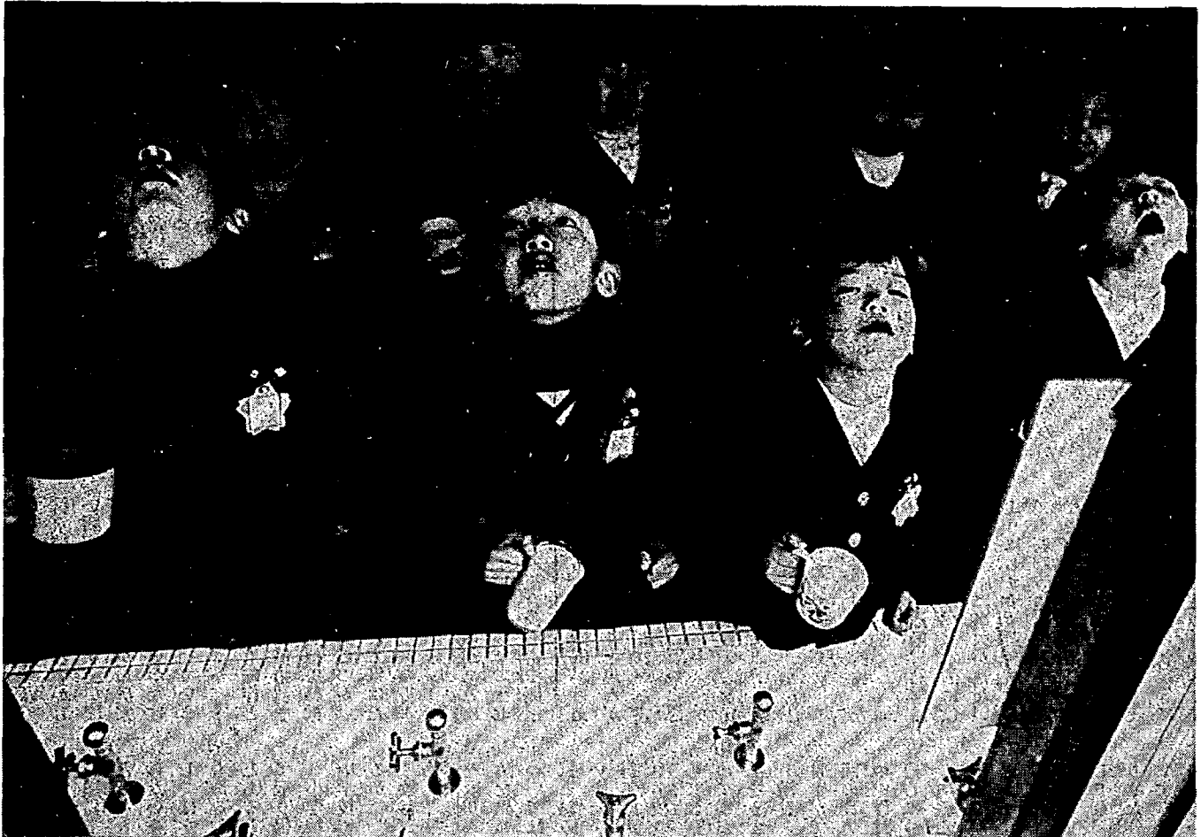
登園したらすぐガラガラ…とうがいをするよい子たち (木の花幼稚園)