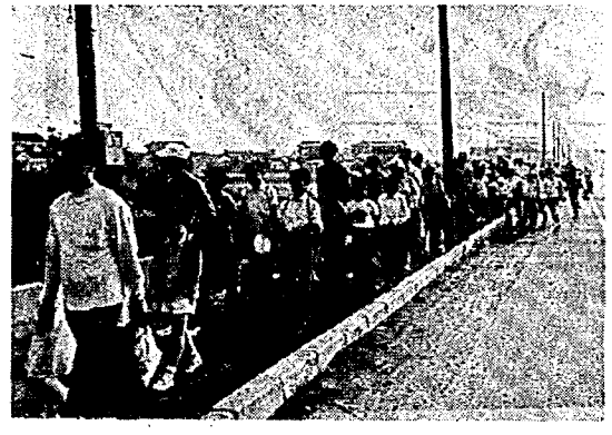
下水道を整備して、快適な居住環境を実現するため町では、公共下水道事業の準備を進めています。

昭和五十一年分の所得稅の確定申告と納稅は三月十五日までです。まだ申告と納稅がお済みにならない人は、早めに済ませてください。 確定申告書の書き方については、稅務署からお送りした「申告書の書き方」や「確定申告の手引き」などに説明してありますが、もっと詳しく知りたいことやよくわからないことがありましたら、お気軽に稅務署内の稅務相談室にご相談ください。 所得稅の確定申告書は、稅務署へ提出した人は、住民稅や、事業稅の申告書を提出しなくてもよいことになっています。確定申告書の住民稅や、事業稅の欄も忘れずに記入してください。 なお、確定申告をしなければならぬ人が申告をしなければならず、誤りのある申告をしますと、決定や更正が行われます。この場合、追加の稅額を納めるだけでなく、加算稅などを納めなければならぬことになり、申告するときには、よく確かめて、正しい申告をしてください。