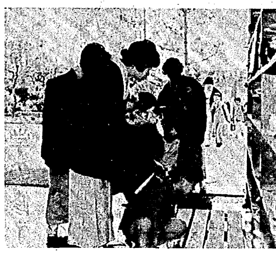
お母さんと一緒に...昨年、東小の入学式で

今年、亀田町で四二七人のかわいい新一年生が誕生します。新入生のお子さんをもつご家庭では、入学期が近づくと「学校生活についていけるかな?」「交通事故にあわないかな?」など、なにかと不安もあつてしまふ。入学前の「しつけ」のポイントをひろつてみました。 ▽健康なからだ 子どもたちは保育園や幼稚園で、集団生活を体験してきています。学校のふん囲気にはそれほど抵抗なく入っているようです。 ▽自分のことは自分で 学校生活の中で、みんなと同じ行動をすることが大切です。体育の時間の着替