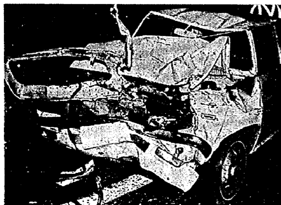
飲酒運転は死亡事故の原因 酒を飲んだらぜったいに運転しない