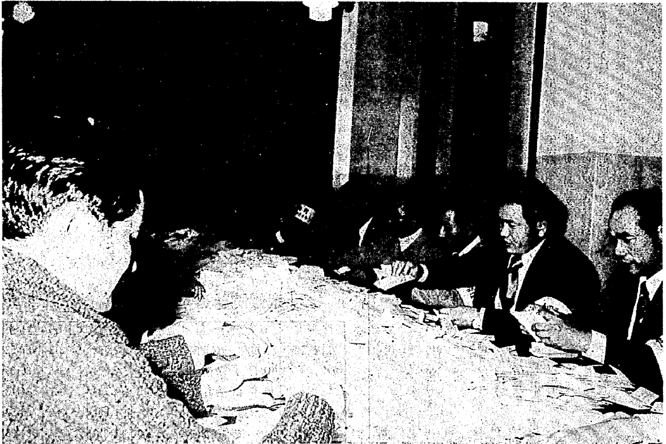
写真…順調に進む開票一役場議場