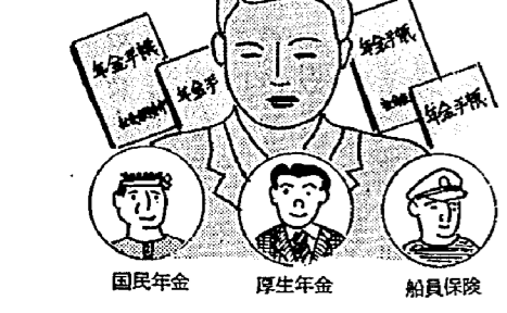
年金手帳は三制度に共通です

や電線等にあてないように注意しましょう。 ◇道路上になるべく雪をおろさないでください。止むを得ずおろす場合は必ず各自で短時間に処理し、通行の支障にならないように十分注意してください。 ◇作業中の除雪車に近づかないようにしてください。とくに、子どもに注意を。 ◇路上駐車は絶対にしてないでください。たった一台の駐車のために除雪計画が狂い、交通の確保が大幅に遅れます。 ◇火の跡始末を完全に寒さが厳しくなるにつれて、暖房器具を多く使用します。このため火災が多く発生しがちです。火の元をいま一度確認しましょう。 ◇石油ストーブ、ガスストーブなどの暖房器具の取扱いは慎重に。灯油、ガソリンなどは規定以上保管しないでください。 ◇住宅を雪囲いするとき避難できるように、非常口を二〜三カ所確保してください。 ◇消火栓、防火用水をいつでも使用できるように除雪にご協力ください。 ◇消火施設を破損した場合は、すぐ消防署に連絡してください。例二三七番 ◇臨時駐車禁止区間は、次のとおりです 十二月一日から五十二年三月三十一日まで ・横濱酒店脇から荻原根入口まで ・三ツ又〜袋津伊夜日子神社前〜袋津山ノ下旧国道四十九号線まで ◇車両交通止 第三諏訪踏切(但し二輪車を除く)