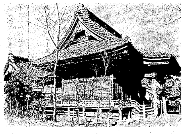
新潟市沼垂蒲原神社

それそれ柵戸を設けて、一面開墾一面蝦夷の侵入に備えたといわれ、これに記された沼尾の地とかわりかともいわれていますが、とにかく沼尾の地とかわりかともいわれると思われ、