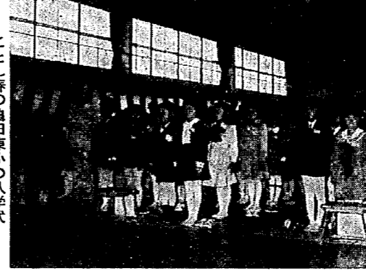
ことし春の亀田東小の入学式

お届けします 新入学児童の通知書 ながく厳しい冬が終るといよいよ、入学シーズンです。今年四月、小学校へ入学する児童は、昭和四十五年四月二日から昭和四十六年四月一日までに生まれた子どもたちです。