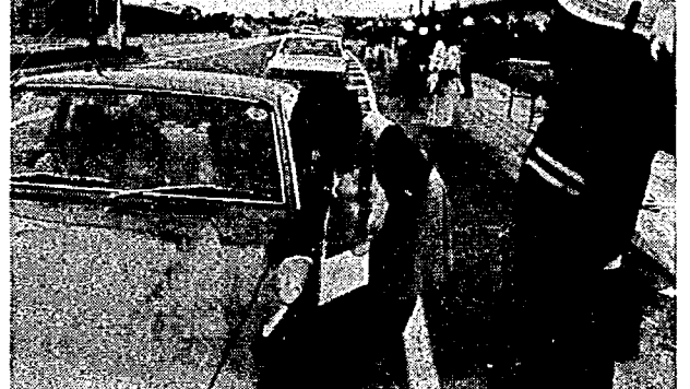
運転に気をつけてねとオシホリを渡す…交通安全母の会

一、歯の治療は保険で十分です。保険で歯の治療を受けようとするときは、保険を扱っている歯科医院の窓口で保険証を提出すれば、通常必要とする治療は、全部で済むようになっていきます。保険を使用して歯の治療をする場合、患者さんの負担額は次のとおりです。 健康保険と国民健康保険の場合 【例】 (1)健康保険の被保険者である患者さんの場合： 二百円（初診時の一部負担金です。）入院された場合は別です。 (2)健康保険の被扶養者または国民健康保険の被保険者 (3)虫歯の予防（歯にフッ素を塗布する方法など） このほか、通常必要とする治療外の治療（特殊な材料などを使用する治療）についても給付できないことになっていきます。 二、保険でできない治療 健康保険、国民健康保険などでは、疾病、負傷に對して給付を行う保険です。で、次のような事例については、給付できないことになっていきます。 (1)健康診断。 (2)歯列矯正（歯並びをそろえる治療）や美容を目的とするもの。 (3)虫歯の予防（歯にフッ素を塗布する方法など） このほか、通常必要とする治療外の治療（特殊な材料などを使用する治療）についても給付できないことになっていきます。 三、七月三十一日、差額徴収治療は廃止されました。 保険でできる金（前歯にを入れる十四カラットの金など）以上の金・白金・特殊な材料などを使用する治療についてのいわゆる差額徴収治療の制度は七月三十一日限りで廃止されました。どうしても患者さんが、金や白金・白金加工金などの特殊な材料を希望される場合は、あらかじめ歯科医師と十分話し合い、金額についても見積書等によって確認され、納得のされたりえて行うようにしてください。 歯は、私たちの健康に深い関係をもっていますので、常に歯の衛生に気をつけてください。もし歯や歯ぐきの病気になるたら、一日も早く治療することが必要です。