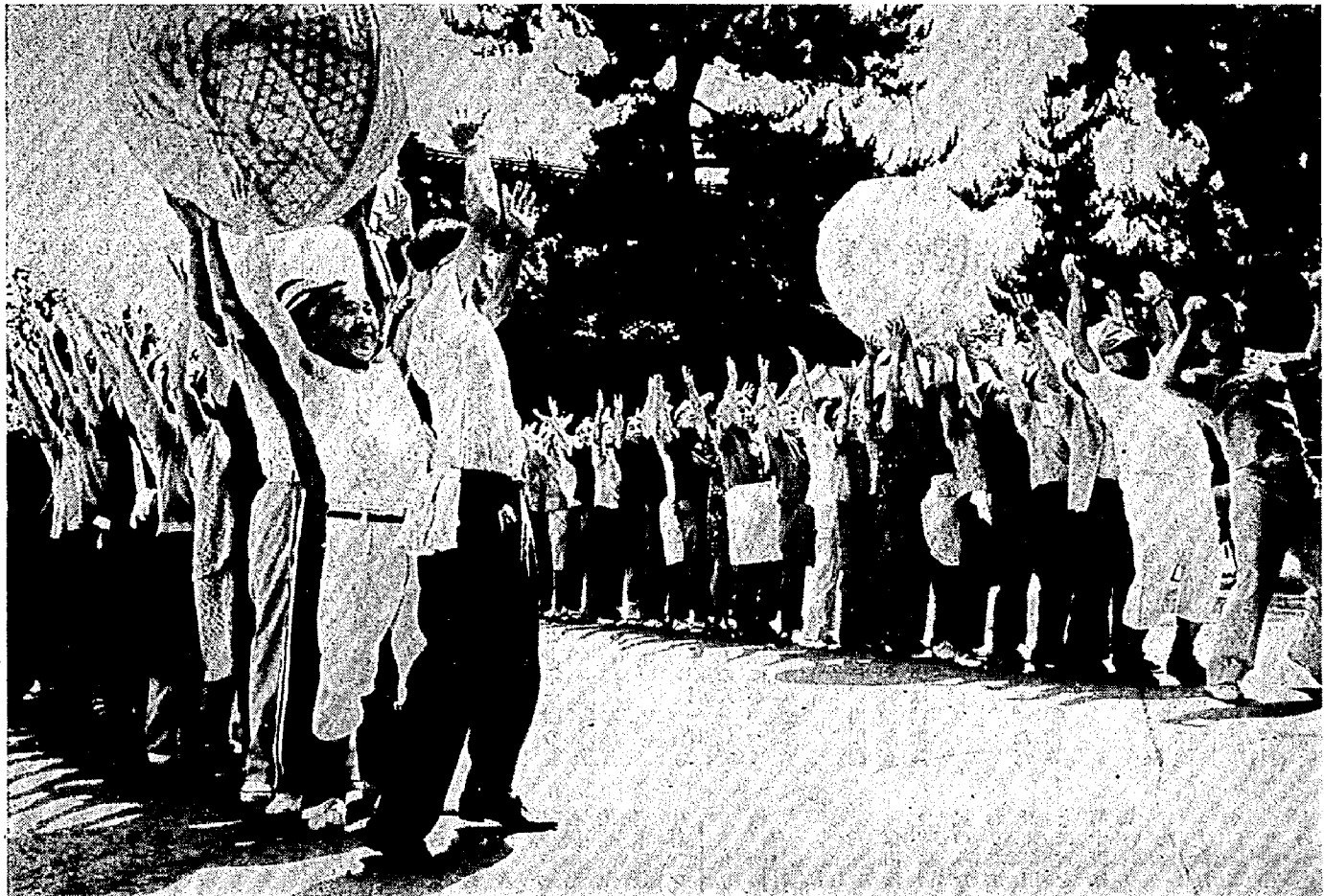
写真…紅白にわかれて元気いっぱい大玉送りをする福寿大学生