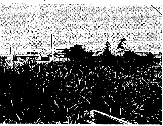
丸 湯 部 落