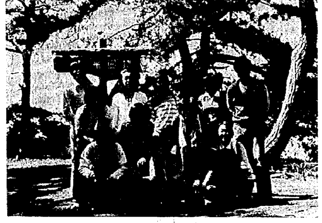
若者のつどい……角田山ハイキング

公民館では、五年前から夏休みの期間を利用して、キャンプにハイキングに出かける町民の方々に、テントやキャンプ用具の無料貸出しを行っています。