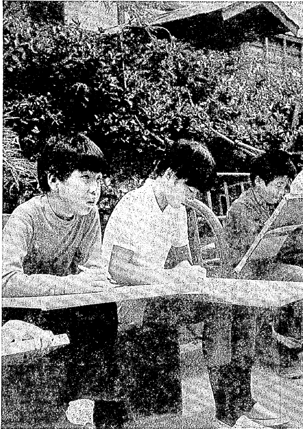
秋の日射しをうけ、2日の児童作品展にそなえて「働く人」を描く…市場通りで