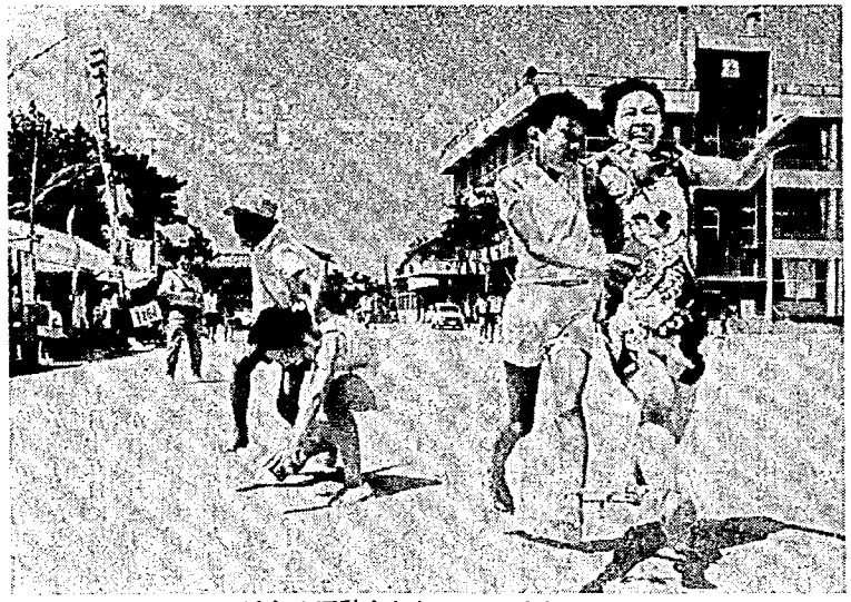
一昨年の運動会から アベックレース

みんなでお出よう セミの声とともに、いよよ本格的な暑さがおとずれてきます。 野に出、また水をもとめて海へと子どもたちが、まっくらになって自然に親しむ季節です。 ことしも、町民の健康増進とスポーツにみんなが親しむために、町民運動会を