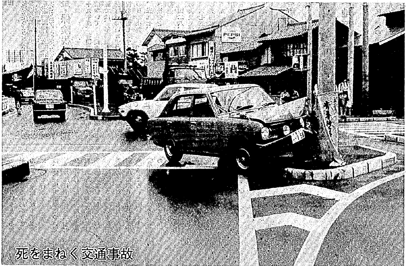
死をまねく交通事故