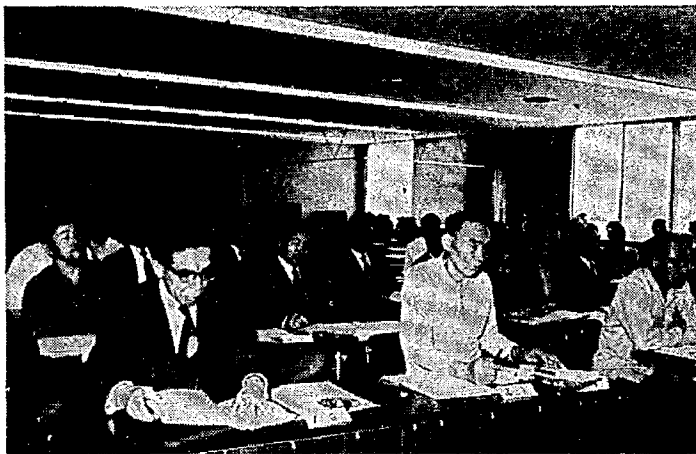
町が提案した議題を討議する区長さん

四十九年度の納税は、初期の目的を達成し、五月三十一日をもって閉鎖しました。さいわい一般会計、特別会計とも欠陥はありませんでした。 四十九年度の納税金額は前年度にくらべて、約一億三千万円増えたため、〇・二六％納税成績が落ちました。五十年度は、未納、滞納者に対して、ある程度の手段をもって、前向きに取り組んでいかなければならぬと思っております。 今後とも町民のみなさんから、町の施策をご理解いただき、一層町税・保険税