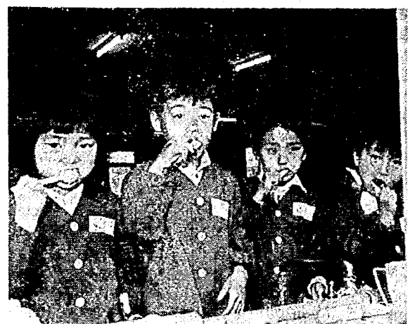
おやつのは、みんなで歯みがき 第四保育園の園児