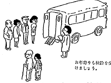
お年寄りも検診を受けましょう。