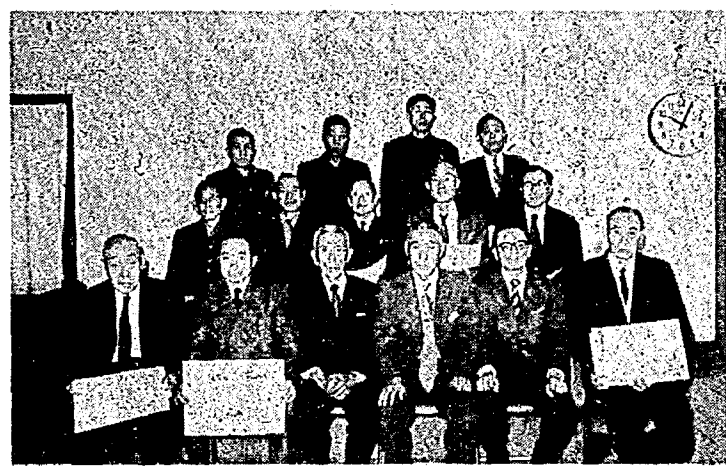
伝達式に参加された受賞者のみなさん

九月六日県民会館において、日赤赤十字会館竣工記念大会が二十名の方々が授与され、十一月二十九日それぞれ該当者に伝達されました。受賞された方々は次のとおりです。