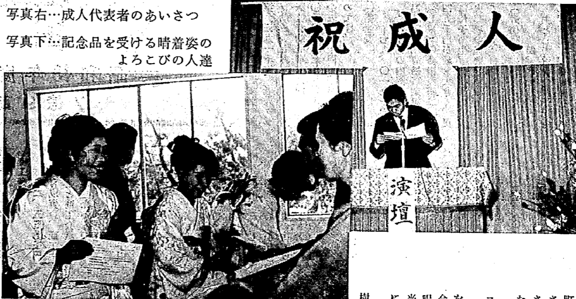
写真右…成人代表者のあいさつ 写真下…記念品を受ける晴着姿のよろこびの人達

長かった雪国の里にも春の訪れを感じる三月二十一日(春分の日)、公民館ホールにおよそ二五〇人の成人を迎えた若人の門出を祝う成人式が催されました。