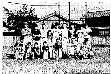
(優勝した舟戸山チーム)

各千円づつ贈られ、九十才 以上の方々七名に町より生 菓子一箱づつ贈られました 金婚者十二組の方々は 「めもと茶わん」を贈られ ました。