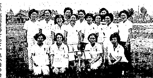
三年連続優勝をめざす亀小母の会

一位 亀田小学校母の会A 二位 亀田小学校母の会B 三位 亀田製菓 四位 東小学校母の会 五位 ソフトボール大会 六位 丸染製粉 七位 マニエル産 八位 乙川鉄工 九位 役場