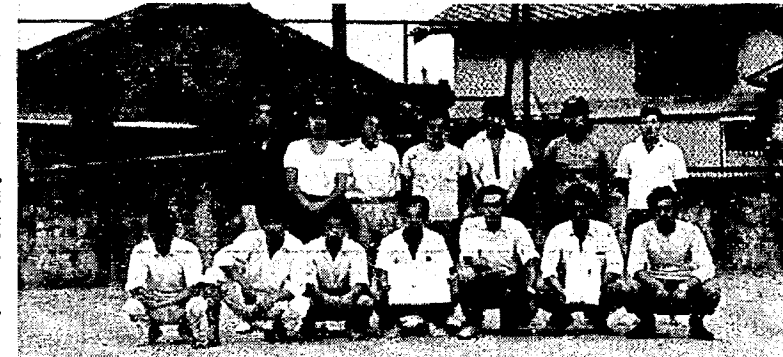
(よろこびの丸染製粉チーム)

県民の体位向上と明朗さをと「県民スポーツの日」を設けてから、はやくも第六回目をかぞえており、亀田町では六月十四日を体育の日として、早朝六時から歩け歩け運動をかかわりに、男子は四十才以上の人を含めてソフトボール大会、婦人は簡易バレーボール大会、サイクリング(七日)の四種目を実施いたしました。 ことしは参加チームも多くソフトボールは十一チーム、婦人バレーボールは十二チームの出場があり、ふだんつかわぬ筋肉をのばしてウソ、ウソウなりながら大ハッスル、途中でヘタバル風景もみられました。 各校の母の会のお母さん方も子どもづれて可愛い声援をうけながら懸命にボールを追っておりました。婦人バレーボールは練習量をほころ亀小母の会チームが二年連続優勝をいたしました。 また、ソフトボールは四十才、五十才の速選手の躍で終始珍ブレイの連続、丸染製粉チームが宿願の優勝を挙げました。