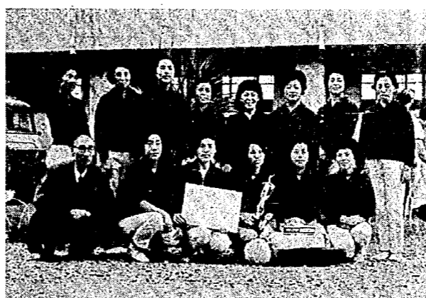
お母さんバレーボール第三位に さる十月五日、新発田市で「体力づく……り県中央大会」が開かれ、……「お母さんバレーボール大……会」に亀田小学校の会を中……心とした亀田チームが、……みごと第三位に入賞いたし……ました。

所得制限の緩和と……夫婦受給の金額支給……について 福祉年金を受け取る本人、……扶養義務者が現行法による……所得制限額以上の所得があ……るため、その支給が停止さ……れている人が多くあります……が、改正によって（所得制……限の緩和）その限度額が引……き上げられ、支給される……という人は、五分分かれ……らさかのぼって、福祉年金……を受けられることになりま……す。又、夫婦が共に老令福……祉年金を受けるときには、……一人だけ受ける人より月額二……五〇円づつ減額されていた……ものが改正によって全額支……給されることとなります。