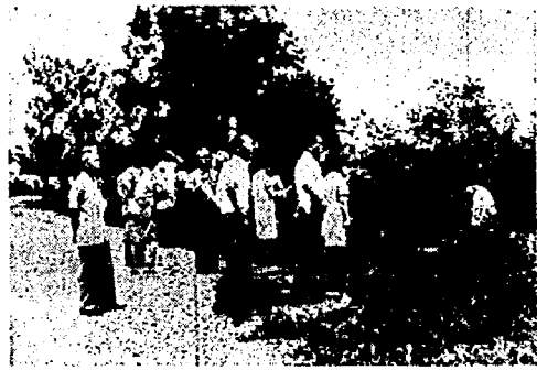
(排水路の汚染状況をみる一行)